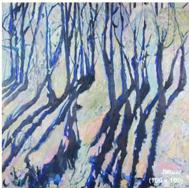
Jänner (100 x 100)