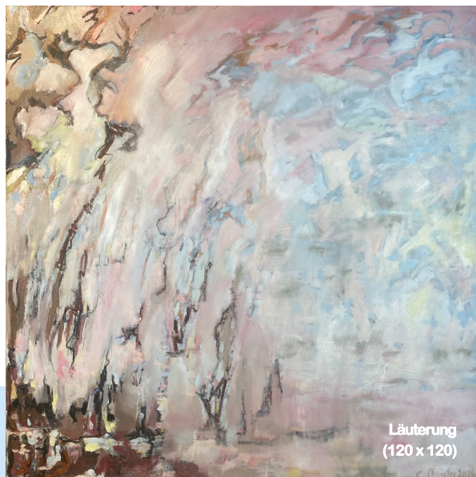
Läuterung (120 x 120)

Conny Pfisters Ölbilder repräsentieren eine aktuelle Facette ihrer langen und intensiven, künstlerischen Auseinandersetzung mit Farben und Formen: Nach ihrer Ausbildung an der Kunstgewerbe-Schule Zürich gründete sie ihre eigene Firma "Contra-Punkt" mit dem Fokus auf keramischen Produkten, Leinen und Wohnaccessoires und entwickelte parallel dazu ihre eigene Ölmalerei: Die vornehmlich grossformatigen, halb-abstrakten Bilder präsentiert sie regelmässig in eigenen Ausstellungen, u.a. in der "Contra-Punkt Galerie" in ihrem Atelier in Bern, wo sie momentan lebt und arbeitet.