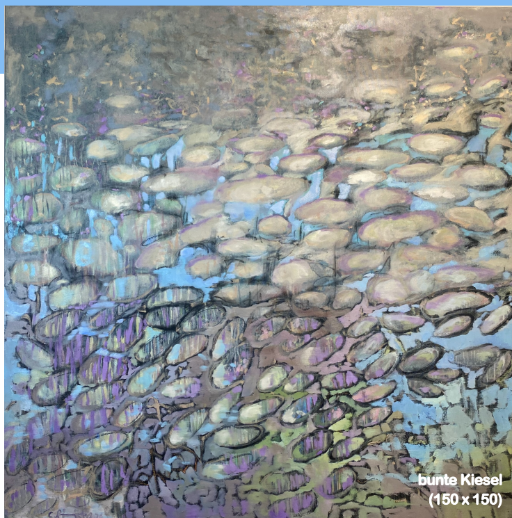
bunte Kiesel (150 x 150)